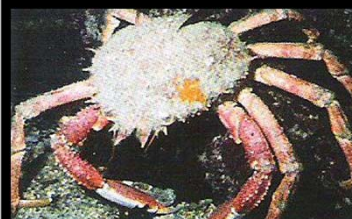
Araignée de mer